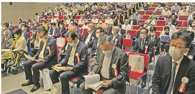
市町村総合体育大会開会式