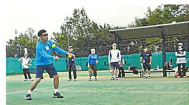
稲城シニアテニス教室 講習スナップ