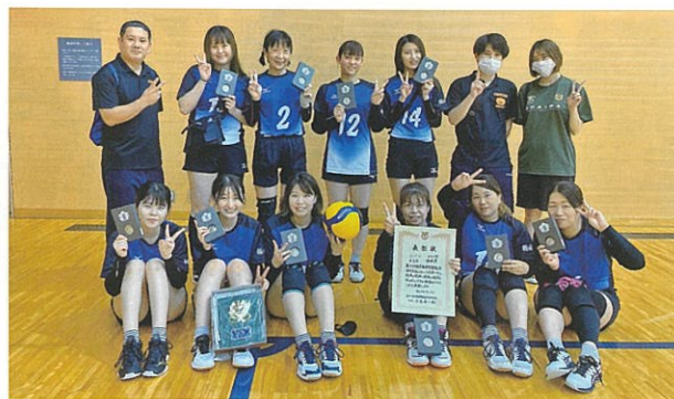
第54回市町村総合体育大会バレーボール準優勝