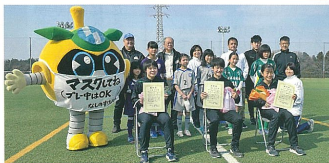
稲城市女子サッカー 顕彰

フェスタの開会式の中で顕彰状授与式をおこない、全国大会優勝のお祝いの場といたしました。市内大会に出場していた選手がその後も活躍し続ける姿は本連盟としても大変誇らしく、さらなる活躍を期待するものであります。