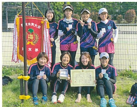
第75回都民体育大会ソフトテニス女子優勝