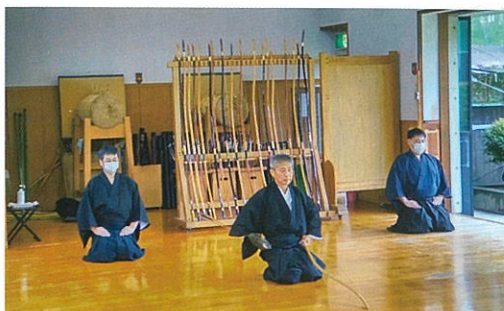
射手と第一・第二介添

とは喜ばしいことです。今年（令和五年）はいよいよ30周年を迎えます。記念事業として、記念誌の発行、記念射会の開催などを予定しており、着々と準備を進めています。（宇留賀 記）