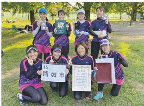
第54回市町村総合体育大会ソフトテニス女子優勝