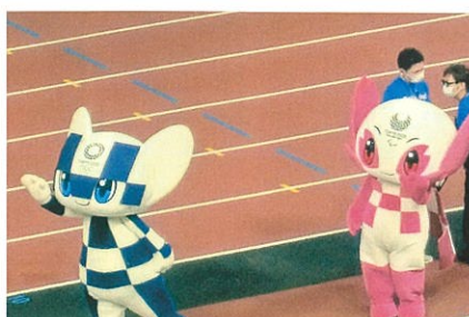
東京大会マスコット