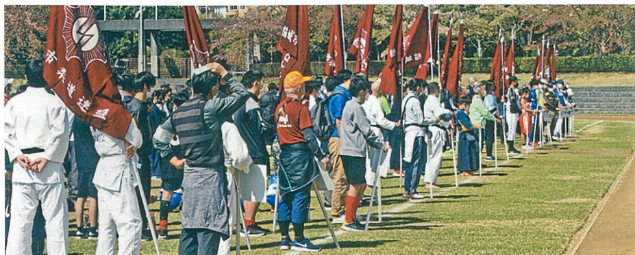
スポーツ大会開会式

第54回稲城市民体育大会総合開会式は9月4日稲城中央公園総合グラウンドで予定されていましたが、グラウンド不良の為中止されました。各種競技は新型コロナウイルスの感染対策を行いながら実施されました。