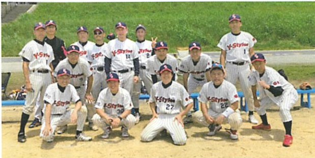
都ソ協主催実年ソフトボール大会でのY-Stylesチーム

このほかに、59歳以上からなるシニア合同チームは、シニア健康スポーツフェスティバルに毎年出場し、全国大会を目指して頑張っています。