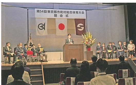
市町村総合体育大会閉会式