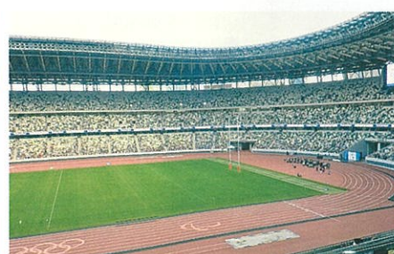
国立競技場のフィールド