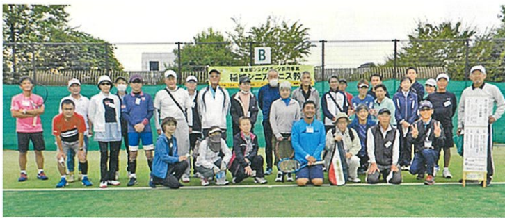
2022年10月22日（土）若葉台公園 稲城シニアテニス教室 集合写真