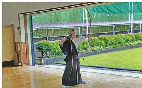
月例会における矢渡し

弓道教室は年二回開催されています。四月から六月にかけて開かれた前期の弓道教室では15名が参加し、全員修了し、そのうち8名が当連盟に加入しました。新しいメンバーが加わるこ