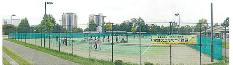
2022年10月22日（土）稲城シニアテニス教室 教室全体写真