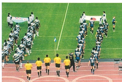
7人制ラグビー代表入場式