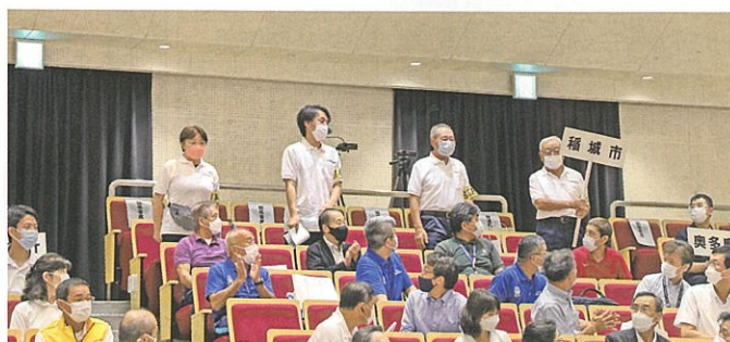
市町村総合体育大会開会式