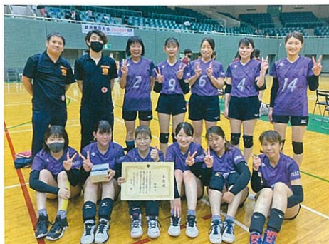
第75回都民体育大会バレーボール女子三位

広報委員会メンバーが中心となって開設準備を進めてきましたホームページは、令和四年四月から運用を開始しました。大会や研修会等を通じて当協会の活動を市民に知って頂き、「市民ひとりスポーツ」に貢献していきたいと思います。