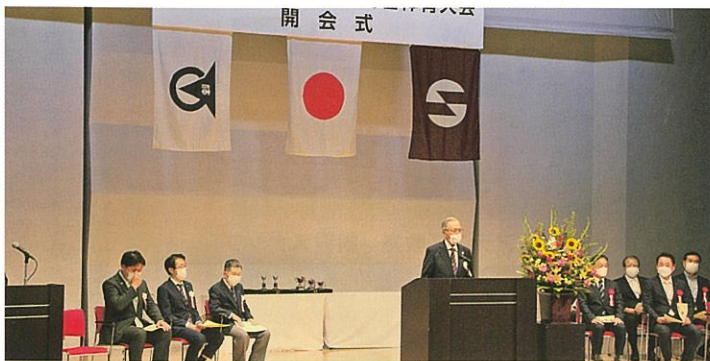
市町村総合体育大会開会式