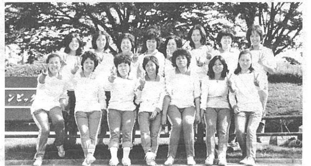
▲ 第4位Vサインも一段と目立つレディースチームの美女

家事、育児と日頃の煩わしさを一時でも忘れて、健康と美容(?)のためにとチームを結成して二年になります。またたくの素人のお母さん達が、家族の理解のもとにコーチ陣の真摯な指導によって練習を続けることが出来、稲城市スポーツ大会で、念願の優勝を為し遂げ、ついに都民大会に出場することができました。学生時代ですら経験し得なかった駒沢球場でのプレーとなると、やはり、うれしい反面不安も募るばかり.....。都民大会での成績は、実力ばかりでなく運もありました。惜しかった。もう一息のカベ。卓球◇ 練習 港区 1:4