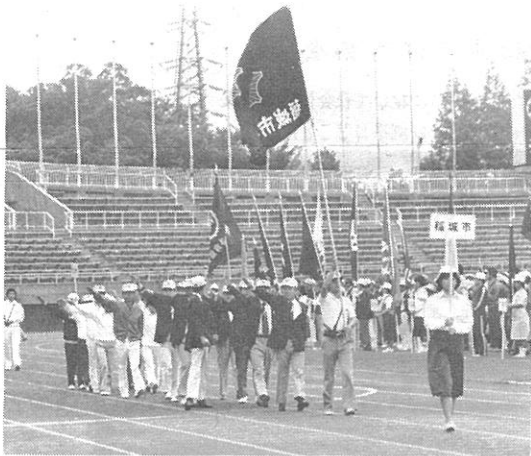
▲ 団旗をなびかせ堂々の入場行進