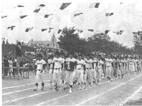
▲ このまま、関東、全国大会へ！！

また、二部の中学の部も毎年夏に開催（全日本大会及び関東大会予選）され、神宮球場で、入場式が行われ、