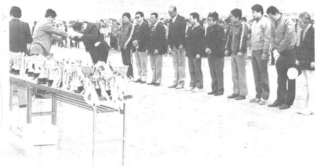
第7回スポーツ大会開会式会場で表彰を受ける功労者の皆さん