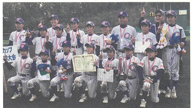
優勝の向陽台スターキッズ

平成27年11月に行なわれた第7回セガサミーカップ学童軟式野球大会決勝戦で文京区の菊坂ファイヤーズを4回コールド、16対1で見事優勝しました。これ迄も都大会上位入賞の常連ですが優勝は初。おめでとう。