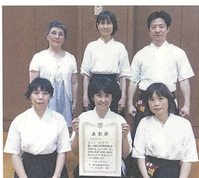
▶市町村大会昨年八位入賞