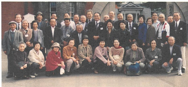
平成16年10月の交流訪問のとき