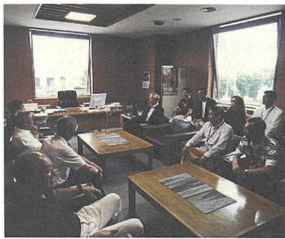
大空町山下町長表敬訪問

体育協会の交流は平成5年10月、平成16年10月のスポーツ親善訪問、平成7年5月の女満別町来訪以来となります。（連盟の交流は何回かあります）