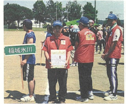
熊本県氷川町の皆さんと