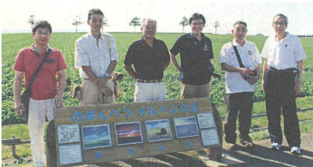
▶交流参加メンバー▶

文末にはなりましたが、事前の調整はもちろんのこと3日間、微に入り細にわたってご案内ご対応くださった大空町の皆様のご厚情に改めて感謝申し上げます。 (宮崎記)