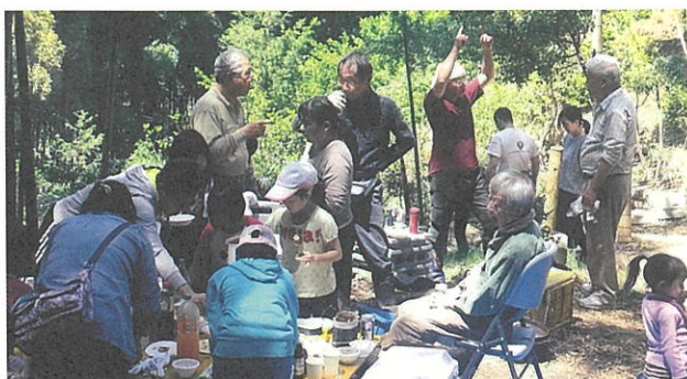
▶バーベキューおいしく