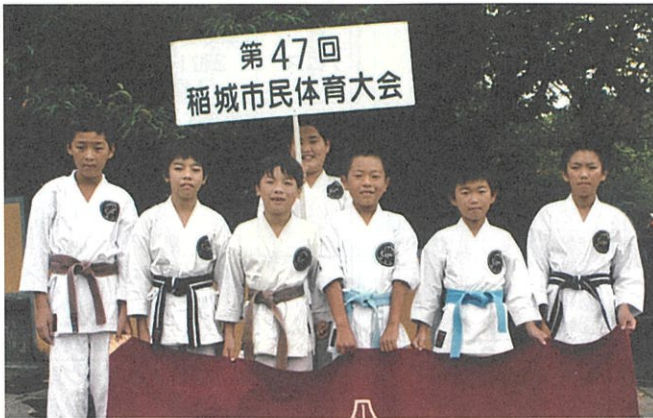
柔道連盟の少年少女たち

第47回稲城市民体育大会は、9月6日(日)総合グラウンドで開会式を行い、21競技にレクリエーション(グラウンドゴルフ)を加えて大勢の市民が参加しています。