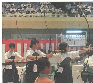
▶全日本錬成大会出場の中学生