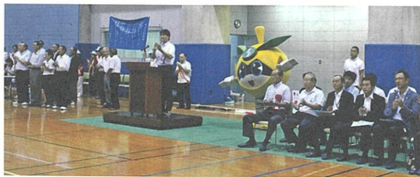
市民大会 市長挨拶