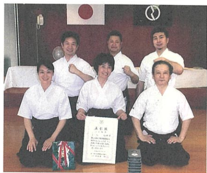
市町村大会準優勝の選手