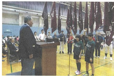
スポーツ大会 選手宣誓