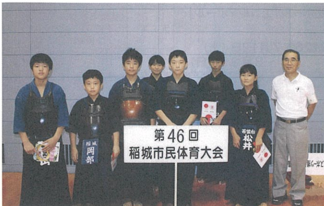
剣道連盟の少年少女たち

第46回稲城市民体育大会は、9月7日(日)総合体育館で開会式を行いスタートしました。21競技にレクリエーション競技を加えて熱戦が展開された。