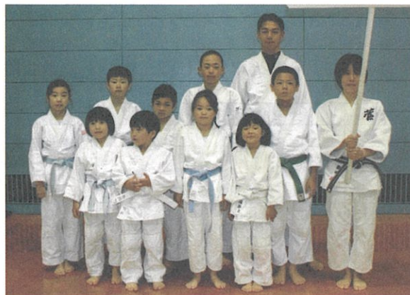
柔道連盟の少年少女たち

26年度稲城市スポーツ大会は4月13日(日)総合体育館で開会式を行い、スポーツシーズンを迎えた。