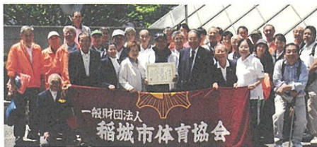
一般財団法人 稲城市体育協会