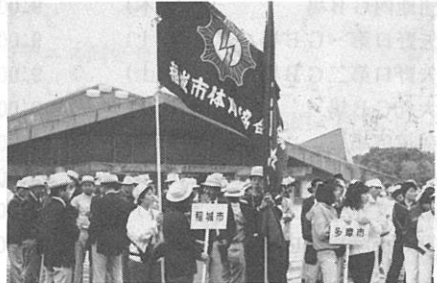
▶都民大会開会式より (駒沢オリンピック競技場)