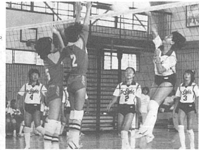
▲大人になんか負けないぞ!

☆ 美しい型 力強い技 逞しい心 空手の練習は美しい姿勢と強靱な体力を造り上げる全身運動です。