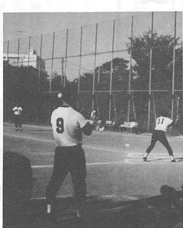
▶一塁コーチ……バッターいいかまえ?