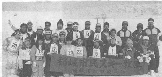
▲美男・美女(天気と雪のおかげ)